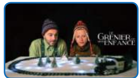
De la lecture mais aussi du théâtre

Vous pouvez emprunter 4 livres, 2 magazines et 2 CD pour une durée de 1 mois.